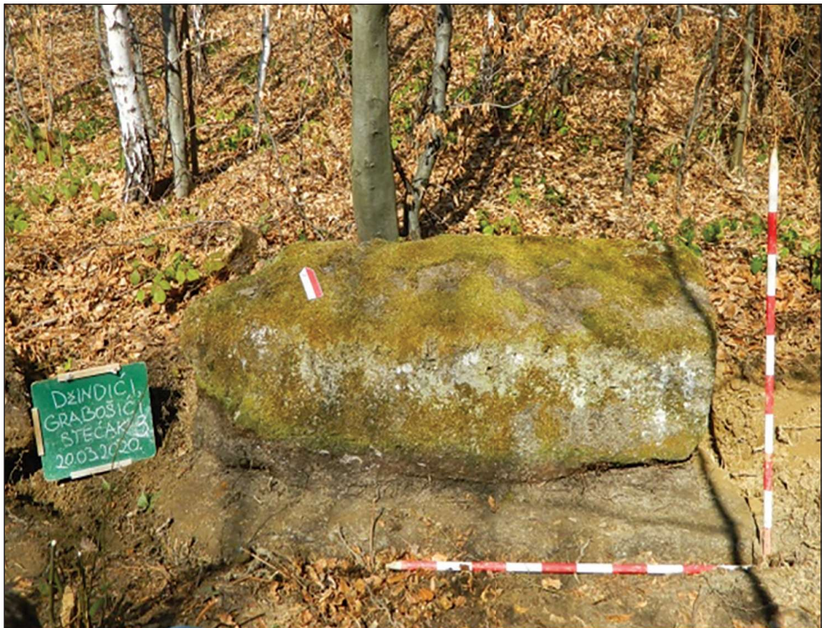
Sl. 2. Džindići, nekropola Grabošić

Detaljnim pregledom stanja na terenu stručni tim je evidentirao 5 stećaka orijentacije Z-I, što je isti broj stećaka kao kod Bešlagića, ali je konstatovano da se nekropola nalazi na veoma nepristupačnoj lokaciji te, iako je detaljno urađena prospekcija, postoji mogućnost da je broj stećaka veći u odnosu na broj koji je evidentiran. Od pet stećaka, samo dva su još na površini, dok su tri identifikovana detaljnim