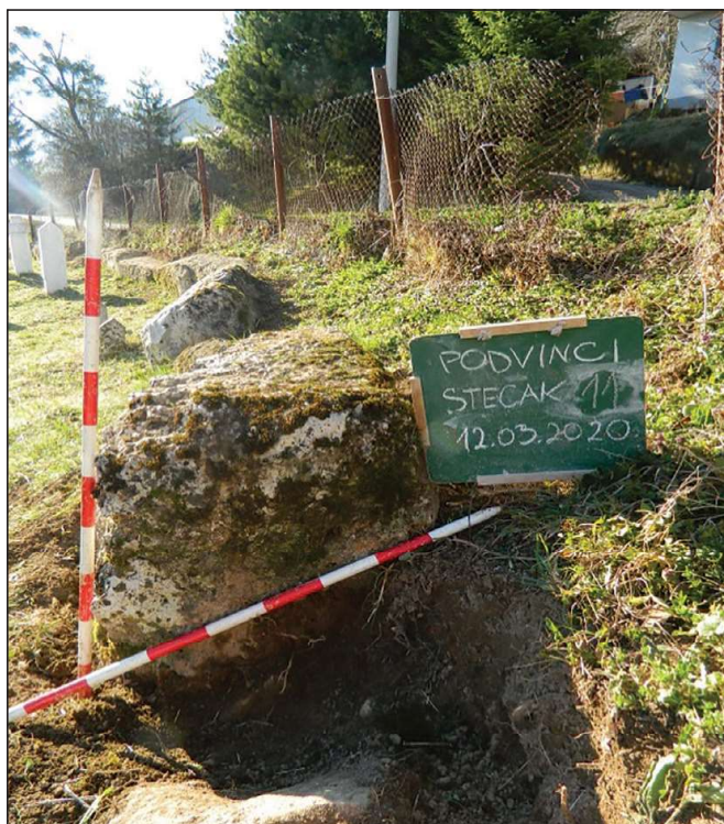
Sl. 5. Podvinci, nekropola Podvinci

evidentirao je i Slaviša Perić i konstatovao je da su stećci dislocirani i da se na nekropoli nalaze 22 stećka u obliku sljemenjaka i sanduka. 25