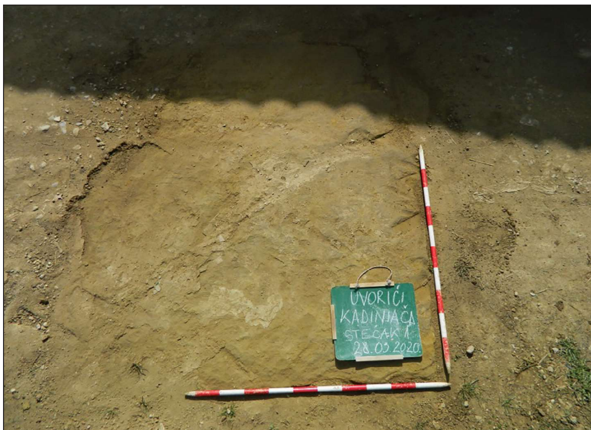
Sl. 6. Uvorići, nekropola Kadinjača

Stručna ekipa Zavičajnog muzeja izvršila je terenski pregled lokaliteta i konstatovala da se nekropola nalazi u vrlo lošem stanju. Nekropola Kadinjača nalazi se u dijelu koji je privatno vlasništvo te su stećci prilikom uređivanja imanja uklonjeni ili uništeni. Trenutno ova nekropola broji samo 2 stećka, koja su u potpunosti utonula u zemlju i dio su prilaznog puta imanju, zbog čega nije moguće utvrditi o kakvim tipovima stećaka se radi. Prema otkrivenom dijelu, konstatovano je da se radi o stećcima veoma velikih gabarita. Oba stećka imaju orijentaciju SJ–JZ. 31 Nekropola Kadinjača obilježena je info-tablom. 32