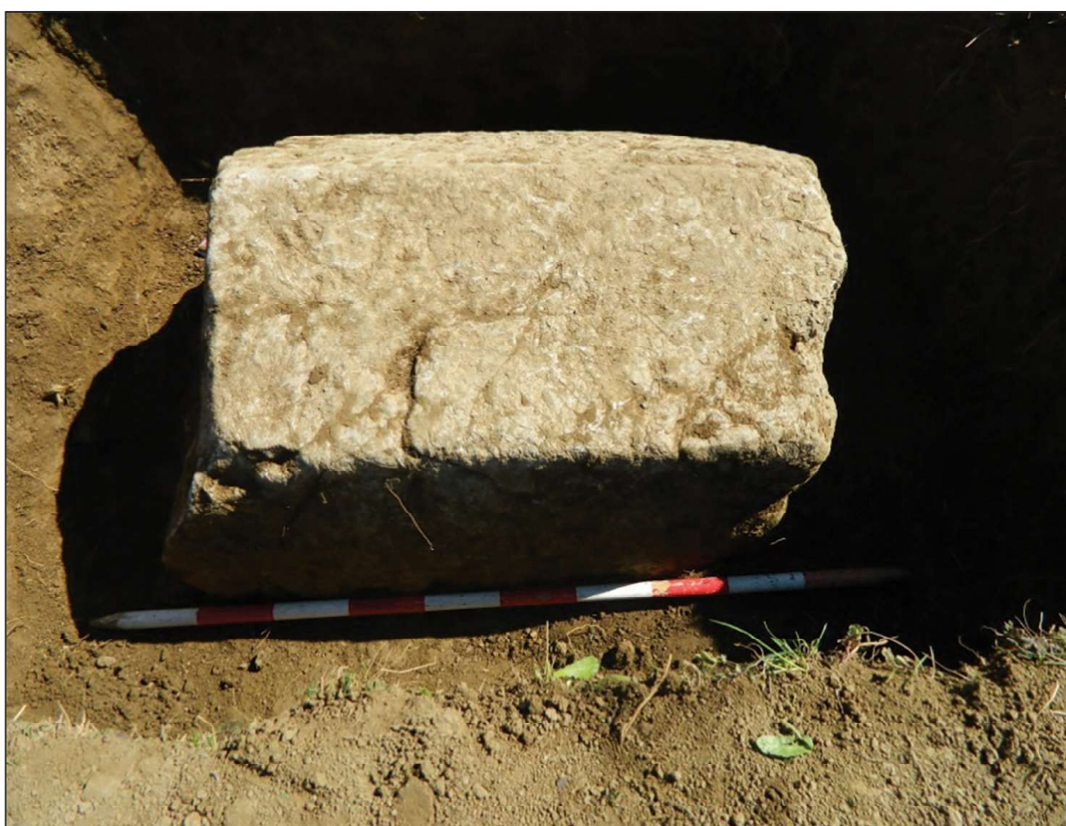
Sl. 8. Zbilje, lokalitet Lopate (Fotodokumentacija Zavičajnog muzeja - Visoko)

Prospekcijom terena stručni tim Muzeja registrovao je još jednu nekropolu u selu Zbilje, koja nije navedena u dosadašnjoj literaturi. Evidentirana su 4 stećka: 3 nadgrobne ploče i 1 sljemenjak. Sljemenjak je pronađen na osnovu kazivanja mještanina, jer se nalazio ispod zemlje nedaleko od jedne ploče. Stećci se nalaze u okviru sadašnjeg muslimanskog mezarja. Zbog lošeg kvaliteta kamena, ali i neodgovornog postupanja mještana, stećci su oštećeni i u lošem su stanju. Stećci su bez ukrasa i orijentacije. 39 Nekropola je obilježena info-tablom. 40