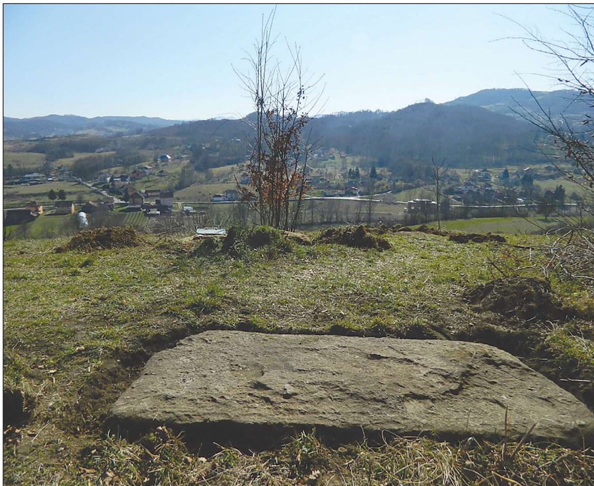
Sl. 4. Maurovići, nekropola Strane / Repni Do

su SZ–JI, izuzev dva stećka koja su orijentacije Z–I zbog pomjeranja iz prvobitnog položaja. 21 Nekropola Strane / Repni Do obilježena je info-tablom. 22