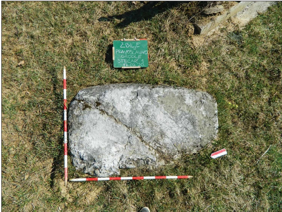
Sl. 7. Zbilje, stećak uz sadašnje Pravoslavno groblje

Nakon što je stručna ekipa Zavičajnog muzeja izvršila terenski pregled lokaliteta, konstatovano je da se jedan preostali stećak nalazi u ograđenom dijelu novog aktivnog pravoslavnog groblja. Stećak je utonuo u zemlju i samo se vidi površinski dio. Orijehtacija je SI–JZ. 36 Nekropola u Pravoslavnom groblju obilježena je info-tablom. 37