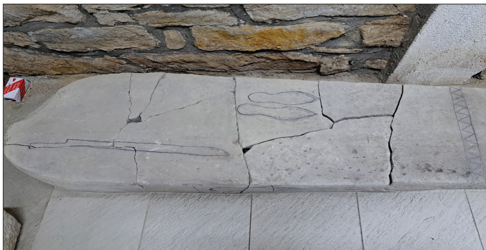
Sl. 3. Originalni fragmenti polomljenog velikog nišana koji se čuva u Zavičajnom muzeju – Visoko