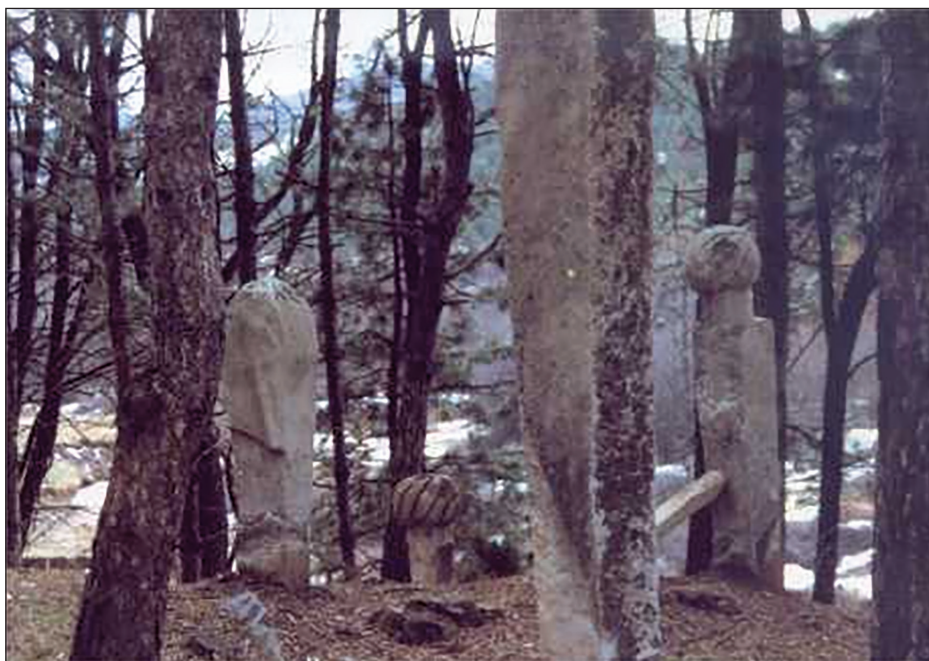
Sl. 2. Mezarje prije devastacije 1993. godine

Sekcije za uzgoj i zaštitu šume Goruša iz Visokog, u jesen 1986. godine, radi odvoza postojeće drvene mase koju su mještani prevlačili. Tada je znatno devastiran veći dio mezarja – polomljeni, izvaljeni i dislocirani stari nišani kao i santrači. U neoštećenom dijelu mezarja ostali su in situ nišani u formi stela i sa turbanom na nekoliko mezara. Prije posljednjih ratnih zbivanja na mezarju se nalazilo desetak nišana dimenzija do dva metra visine sa “glavom” u formi različitih turbana, te nekoliko stela (Sl. 2). Krajem iste (1986) godine pokrenuta je inicijativa Zavičajnog muzeja – Visoko, u saradnji sa tadašnjim inspektorom šumarstva Esadom Durajlićem, za pokretanje postupka sanacije i zaštite mezarja. O ovome je blagovremeno i u više navrata Zavičajni muzej – Visoko obavijestio tadašnji Zavod za zaštitu spomenika kulture, prirodnih znamenitosti i rijetkosti SR BiH sa zahtjevom da stručno lice izvrši uvid u situaciju radi potrebne zaštite i sanacije. Jula 1990. godine, nakon zahtjeva Sekretarijata za privredu i društvene djelatnosti općine Visoko, a na inicijativu Zavičajnog muzeja, Zavod za zaštitu kulturnohistorijskog i prirodnog naslijeđa BiH izdao je Saglasnost za postavljanje ograde oko mezarja.