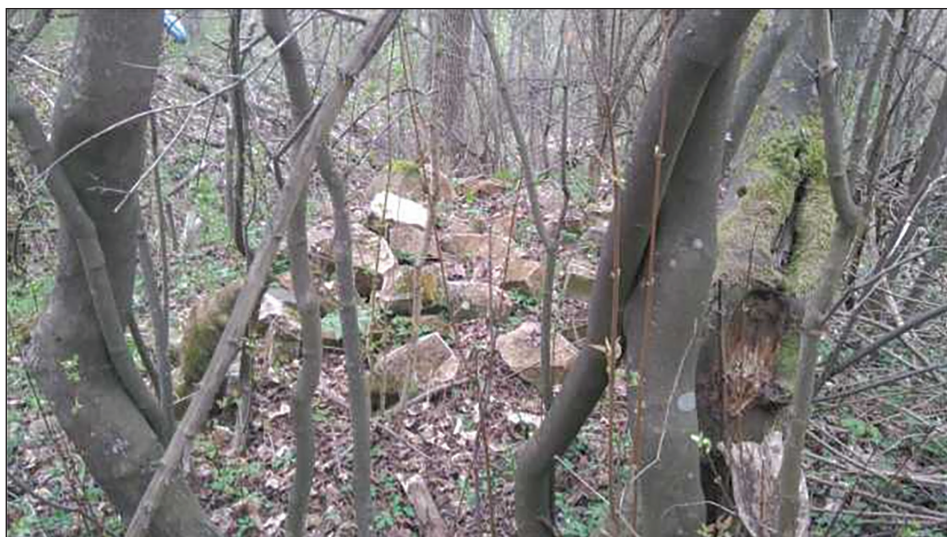
Sl. 5. Dijelovi polomljenih nišana na samom lokalitetu mezarja "Na tekiji"