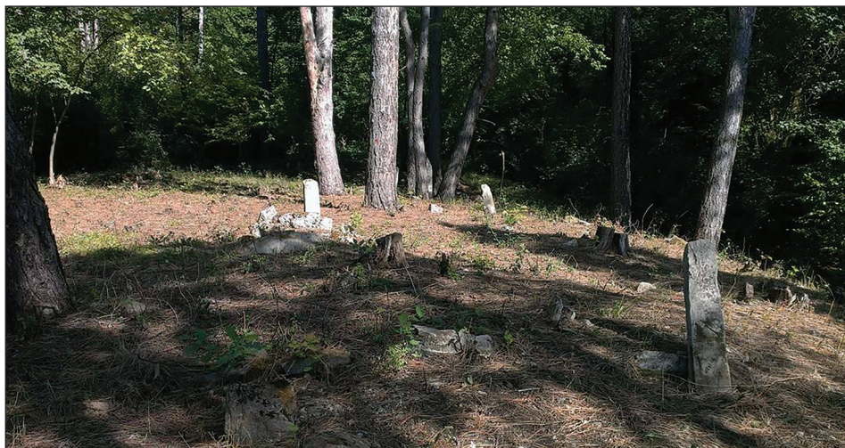
Sl. 1. Mezarje danas

Mezarje “Tekija” / “Na tekiji” je, nažalost, danas u veoma lošem stanju. Uspravni nišani na autentičnim lokacijama gotovo da ne postoje, odnosno mezarje je većim dijelom devastirano. Slučajni prolaznik jedva bi mogao naslutiti da se tu nekad nalazilo mezarje. U mezarju se in situ nalaze fragmenti polomljenih nišana i devastirani santrači djelimično utonuli u zemlju i zarasli u travu (Sl. 1).