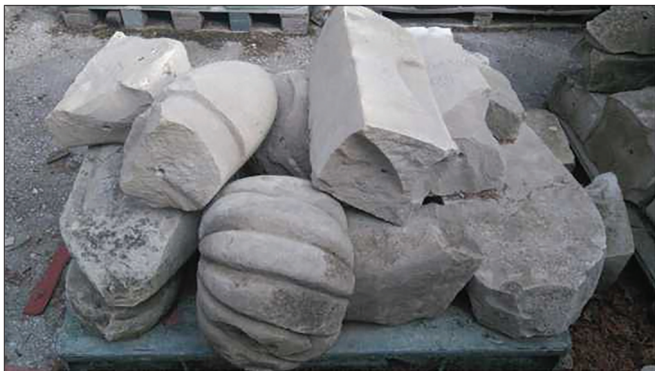
Sl. 6. Fragmenti polomljenih nišana deponovanih u JKP "Gradska groblja Visoko"