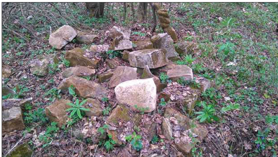
Sl. 4. Dijelovi polomljenih nišana na samom lokalitetu mezarja "Na tekiji"