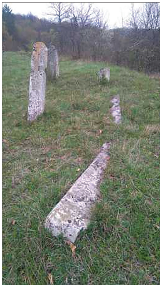
Sl. 7. Mezarje "Šehidova / Šetova luka"

Nakon potpisivanja sporazuma o saradnji Muzeja Sarajeva i Zavičajnog muzeja – Visoko krajem 2022. i u ljeto 2023. godine je, uz finansijsku podršku Fondacije "Visoki" iz Visokog, izvršeno uređenje lokaliteta mezarja. Tom prilikom se, pored čišćenja od korova i rastinja, pristupilo i djelimičnoj konzervaciji nišana in situ , te se determinirao