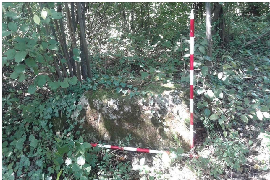
Sl. 2. Tušnjići, lokalitet Kljen/Klen

Stećci na navedenoj nekropoli relativno su dobro očuvani, prekriveni su mahovinom i mjestimično su obrasli bršljenom. Orijentacija Z-I. Stećci su dobro vidljivi i nisu utonuli u zemlju, ali su ugroženi zbog blizine deponije organskog otpada i krečane. 14