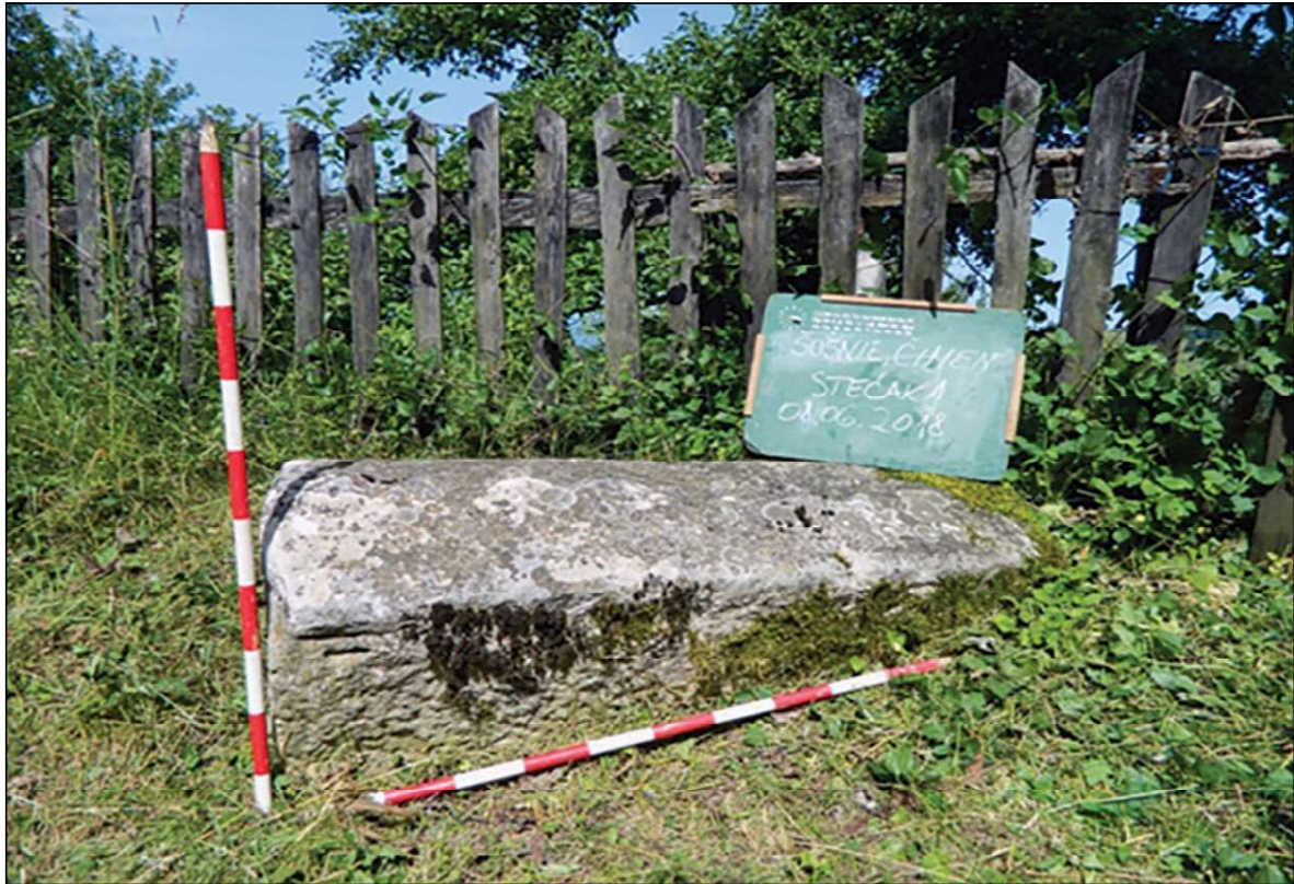
Sl. 12. Šošnje, lokalitet Čimen, sljemenjak, dim. 1,39 x 0,90 x 0,80 m