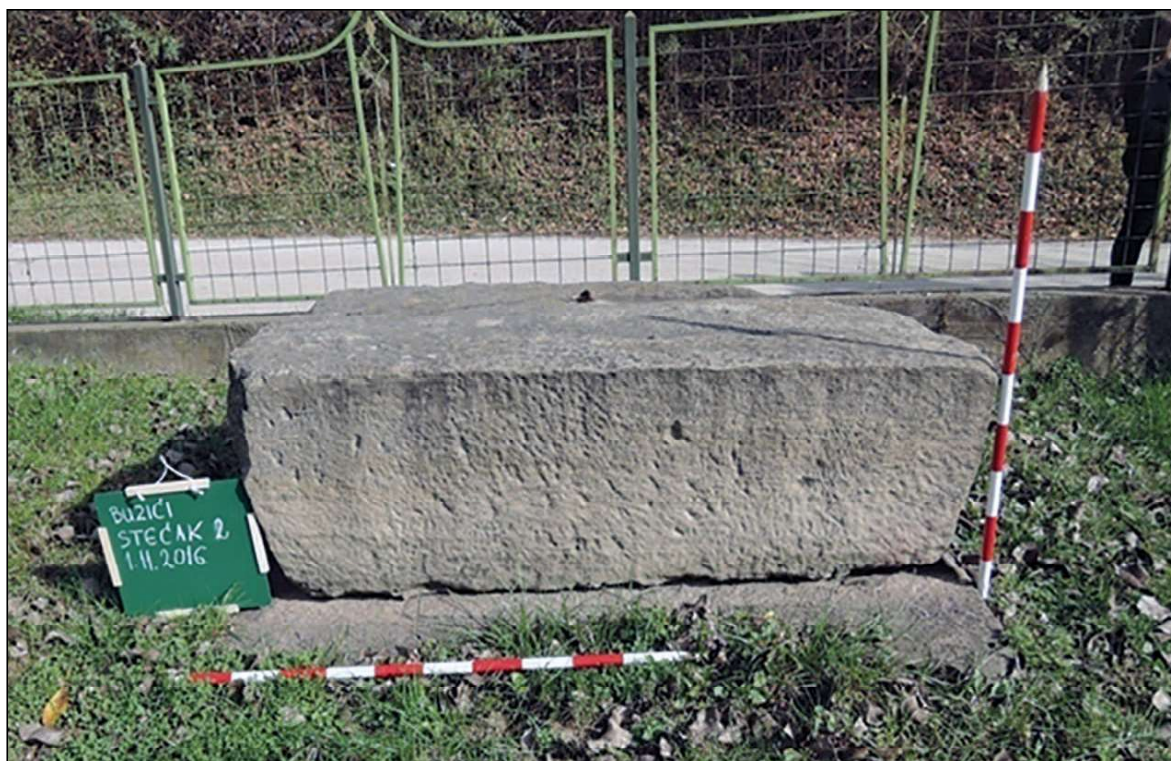
Sl. 7. Buzići, lokalitet Brečak, sanduk sa postoljem, dim. 1,61 x 0,90 x 0,70

očuvani, bez ukrasa i natpisa. Orijentirani su SZ-JI, 30 a ne Z-I, što je ranije evidentirano. 31 Razlog tome je pomjeranje stećaka sa njihovog prvobitnog položaja.