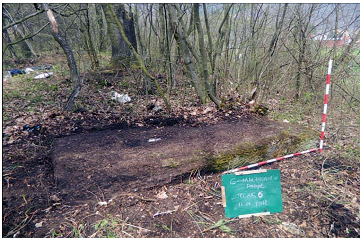
Sl. 15. Gorani/Podgorani, lokalitet Polje, ploča, dim. 2,35 x 1,72 x 0,25 m

Tokom 1983. god. premještena su tri stećka (2 sljemenjaka i 1 sanduk) sa lokaliteta Podgorani – Polje na prostor ispred Zavičajnog muzeja. Spomenici su veoma loše izrade, a na dva stećka se nalaze ukrasi. Prvi u obliku sanduka je ukrašen plastičnim trostrukim krstom, a drugi je sljemenjak ukrašen plastičnim polumjesecom. Izlaskom na teren tokom 2018. god. evidentirano je 20 stećaka: 6 sanduka, 6 ploča, 1 sljemenjak sa postamentom i 7 stećaka za koje se ne može utvrditi oblik zbog njihove oštećenosti i utonulosti u zemlju. Stručni tim Zavičajnog muzeja utvrdio je veći broj stećaka u odnosu na raniji popis kada je evidentiran 21 stećak, od kojih su tri stećka prenesena ispred Muzeja. Također su dati novi podaci koji se odnose na oblike stećaka. Stećci su rađeni od konglomerata i krečnjaka. Slabije su izrade, oštećeni su i utonuli u zemlju. Stećci su bez ukrasa i natpisa. Orijentacija 18 stećaka je SZ-JI i 3 I-Z. Evidentiran je i jedan nišan (ranoosmanski), što ukazuje na kontinuitet sahranjivanja na ovom lokalitetu. 54