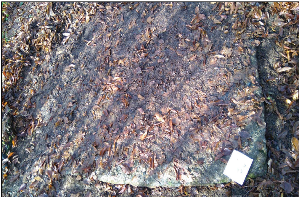
Sl. 5. Gorani, ploča, dim. 1,88 x 1,40 x 0,10 m

Stručni tim izvršio je terenski pregled tokom 2016. god. i evidentirao 73 spomenika (najveći broj je sanduka, ima ploča i dva sanduka sa postoljem), što je manji broj stećaka u odnosu na evidenciju Š. Bešlagića. Ipak, prema ukupnom broju možemo da kažemo da je riječ o većoj nekropoli kao i u selu Tušnjići, te ove dvije nekropole pripadaju onom malom broju nekropola u Bosni i Hercegovini koje imaju preko 50 stećaka. 22 Stećci su od konglomerata, slabo obrađeni, bez ukrasa, oštećeni i utonuli u zemlju. Orijentacija većeg broja stećak je Z-I, dok su ostali stećci orijentacije S-J, 23 te je konstatirano odstupanje u odnosu na raniju evidenciju.