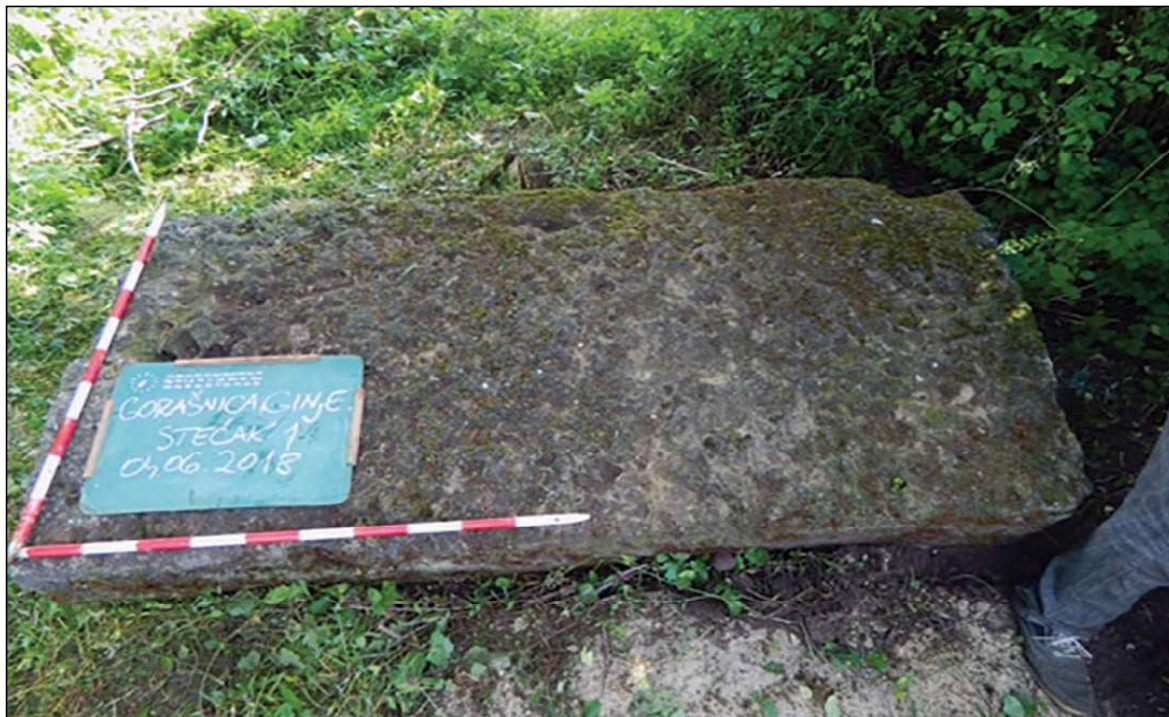
Sl. 13. Ginje, lokalitet Gorašnica/Glavica, sanduk, dim. 2,10 x 1,05 x 0,55 m (Fotodokumentacija Zavičajnog muzeja – Visoko)

obrađeni 8 stećaka su u obliku sanduka, 1 ploča i 2 stećka kod kojih ne možemo odrediti oblik. Stećci su većih dimenzija, dobre su obrade, rađeni od konglomerata i pješčara, ali su veoma oštećeni. Orijentacija 8 stećaka je Z-I, jedan S-J i dva SI-JZ. 48