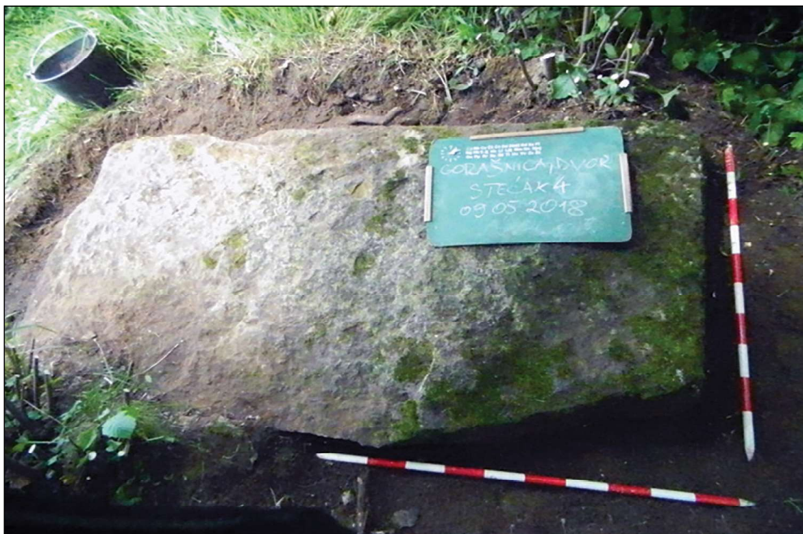
Sl. 14. Dvor, lokalitet Gorašnica, sanduk, dim. 2,05 x 1,05 x 0,40 m