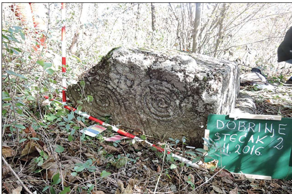
Sl. 8. Dobrinje, lokalitet Dobrinjac, ukrašeni sljemenjak sa postoljem, dim. 1,64 x 0,84 x 0,56m