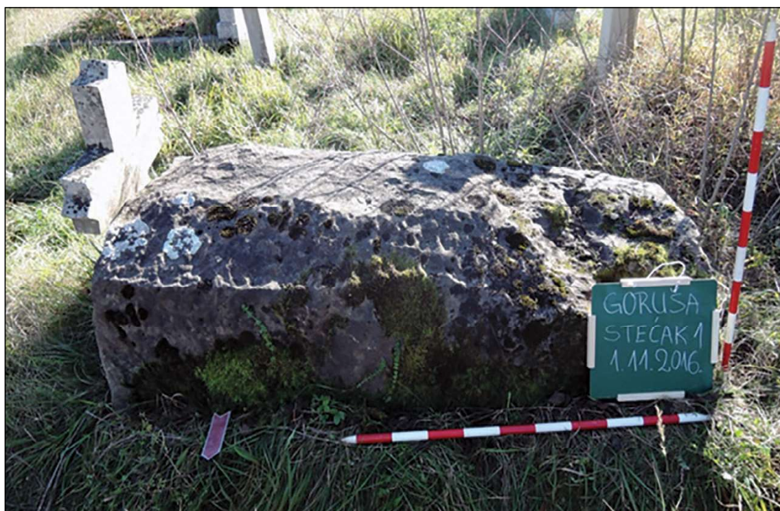
Sl. 10. Gračanica/Goruša (Malo Čajno), lokalitet Zgonovi, sanduk, dim. 1,81 x 1 x 0,60 m

Goruša (Malo Čajno) u Gračanici je udaljena od Visokog 9,5 km u pravcu sjeveroistoka. U Goruši, na lokalitetu Zgonovi 1946. god. otkrivena je nadgrobna ploča kaznaca Nespine koja predstavlja jedan od najzanimljivijih i najreprezentativnijih lapidarnih spomenika srednjovjekovna Bosne. 36 Na ovom lokalitetu formirano je savremeno pravoslavno groblje u okviru kojeg se nalazi i nekropola stećaka. Š. Bešlagić je ovdje evidentirao 11 spomenika u obliku saduka. 37 Isti broj stećaka navodi i P. Anđelić. 38