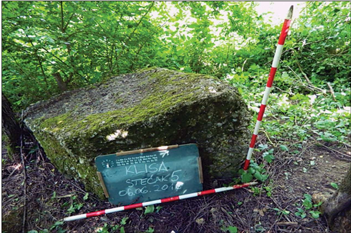
Sl. 11. Visoko, lokalitet Klisa, sanduk, dim. 1,87 x 0,90 x 0,80 m