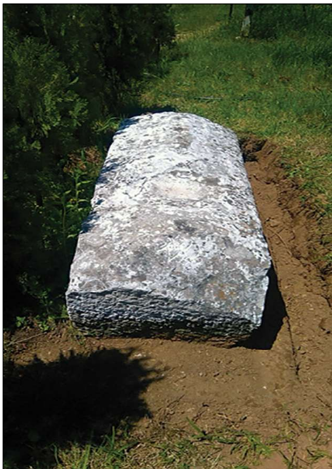
Sl. 6. Radovlje, Slatina, lokalitet Podojnica, sljemenjak, dim. 1,62 x 0,67 x 0,39 m