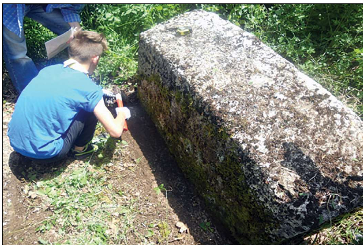
Sl. 3. Selo Zagorice, sljemenjak, dim. stećka bez postamenta 1,40 x 0,67 x 0,70 m, dim. postamenta 1,79 x 0,90 x 0,25 m

Stručni tim izvršio je terenski pregled u selu Zagorice tokom 2016. godine. Tom prilikom konstatirano je da se u okviru pravoslavnog groblja nalaze 2 stećka, što je potvrdilo navode M. Filipovića. Stećci su u obliku sljemenjaka sa postoljem. Izrađeni su od konglomerata i nemaju ukrase ni natpise. Orijeantirani su Z-I. Na stećcima su vidljiva manja oštećenja. 17 Tvrdnje S. Perića nije bilo moguće potvrditi.