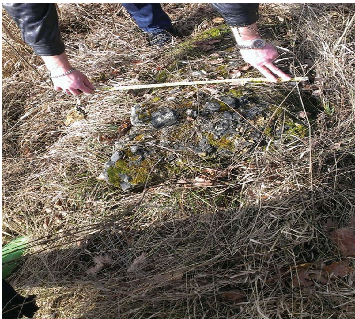
Sl. 4. Grajani, lokalitet stari grad Bedem, sanduk (?), dim. 1,00 x 0,50 m (Fotodokumentacija Zavičajnog muzeja – Visoko)

Izlaskom na teren tokom 2016. god. evidentiran je jedan stećak. Utonuo je u zemlju, pa se sa sigurnošću ne može reći kojeg je oblika (sanduk?). Kamen od kojeg je izrađen je konglomerat loše obrade, bez ukrasa, a orijentiran je SZ-JI. 19